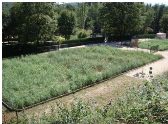
Station en service à St LEON SUR VEZERE