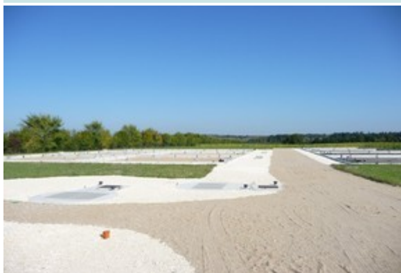
Station juste terminée à SALIGNAC

Quelques pousses de roseaux Phragmites australis