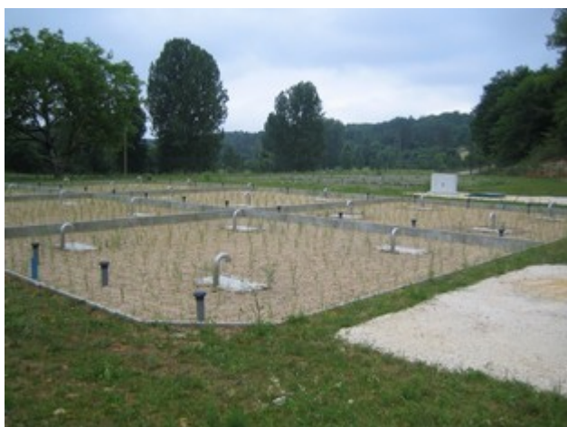
Station juste plantée à St GENIES