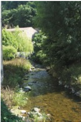
Le Sor, affluent de l'Agout traverse le Tarn et la Haute- Garonne