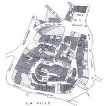
Plan de Saint Julia au XIX e siècle